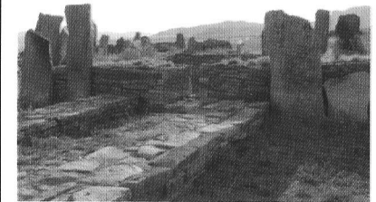
Карагандинская область, недалеко от гор Кызыларай.

100-летний юбилей учёного был отпразднован под эгидой ЮНЕСКО. Имя А. Маргулана носит Институт археологии Академии наук Казахстана.