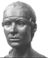
Реконструкция андроновской женщины - жительницы Аркаима Автор: Нечвалова А. И.

Андроновская культура распространялась от Урала на западе до Енисея на востоке, от тайги на севере до гор Памира на юге.