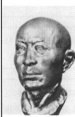
Скульптурная реконструкция по черепу мужчин из могильника Чирик Рабат. Автор В.Г. Лебединская

Саки были европеоидами, однако постепенно в их внешнем облике начинают доминировать монголоидные черты.