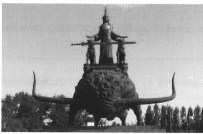
Памятник царице Томирис в Астане.

О битве саков с персами писали римский историк Помпей Трог и греческий историк Геродот.