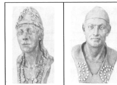
Скульптурная реконструкция по черепам женщины и мужчины Жетыясарской культуры

Долина ныне высохших рек Куандарьи и Жанадарьи