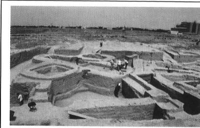
Городище кангюев Куль-тобе на берегу р. Арысь. Туркестан.