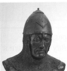
Половец из Квашниково. XII — XIII вв. Реконструкция Г. В. Лебединской.