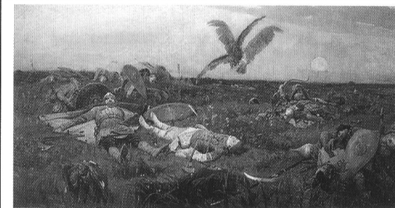
Картина В. М. Васнецова "После побоища Игоря Святославича с половцами".

Кыпчакское ханство окончательно пало под натиском монгольского нашествия, его территория вошла в состав улуса Жоши .