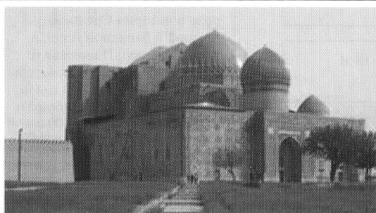
Мавзолей Ходжи Ахмета Яссауи. Г.Туркестан. Фасад мавзолея направлен на восток. Рядом с ним находится мавзолей внуки Тимура Рабиги Султан Бегим (XV в.).

Тимур оставил после себя десятки монументальных архитектурных сооружений, некоторые из них вошли в сокровищницу мировой культуры. Например, мавзолей Ходжи Ахмета Яссауи, возведенный по приказу Тимура в 1398 г. Столица эмира Тимура – город Самарканд является выдающимся памятником архитектуры и охраняется ЮНЕСКО.