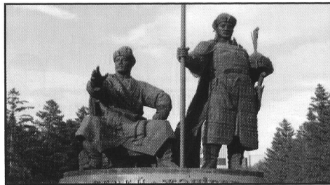
Памятник Керей и Жанибеку в г. Астане