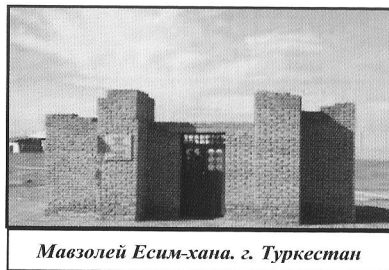
Мавзолей Есим-хана. г. Туркестан

После смерти хана Тауекела ханом был провозглашен его младший брат Есим . За высокий рост и мужественность его называли « смелый и статный ». Цель его политики: превращение Казахского ханства в сильное централизованное государство.