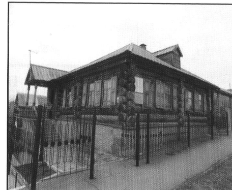
Дом-музей Емельяна Пугачёва в г.Уральске

Оказывая сопротивление, казахи были вынуждены откочевать в глубь степей, где продолжили борьбу. В сентябре 1775 г. в Младшем жузе появился человек по имени Коктемир (невидимка). Он обещал казахам скорое возвращение Пугачева и призывал их продолжить борьбу. В 1775-1776 гг. отряды Коктемира сосредоточились между Гурьевым и Кулагиной крепостью и постоянно нападали на отряды регулярных войск, форты и крепости. Летом 1776 г. движение «Невидимки» было ликвидировано.