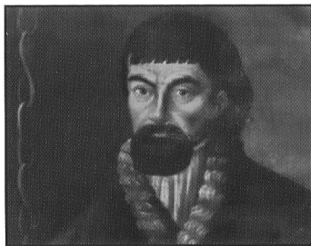
Портрет Пугачёва, написанный с натуры. Надпись на портрете: «Подлинное изображение бунтовщика и обманщика Емельки Пугачёва».

В 1773 г. в Российской империи вспыхнуло крестьянское восстание под предводительством донского казака Емельяна Ивановича Пугачева, который выдавал себя за чудом уцелевшего царя Петра III.