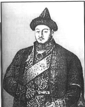
Портрет хана Жангира (1832–1840 гг.)

По указу Павла I в низовьях междуречья Урала и Волги 11 марта 1801 г. было образовано Внутреннее, или Букеевское ханство.