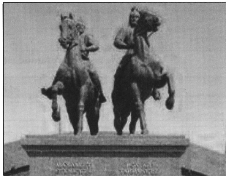
Памятник Исатаю Тайманову и Махамбету Утемисову в г.Атырау

Составная часть освободительной борьбы народов Российской империи.