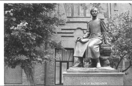
Памятник Ш.Валиханову в г.Омске

В 1861г. Шокан тяжело заболел. В Омске он участвовал в подготовке судебной реформы. В 1864г. был членом военной экспедиции генерала М.Г.Черняева в Аулие-Атинскую крепость. Но, разочаровавшись в действиях генерала, подал в отставку и вернулся в г. Верный. В апреле 1865г. он скончался и был похоронен в местности Кошен тоганы, Алтын –Эмель (совр. Алматинская обл.). В 1895г. Потанин посетит аул отца Шокана и издаст труд «В юрте последнего киргизского царевича», который будет опубликован в журнале "Русское богатство" в 1896г. Именем Ш. Валиханова назван институт истории и этнологии в г.Алматы.