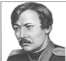
Шокан Чингисович Валиханов (наст. имя Мухаммед-Ханафия)

Казахский историк, этнограф, фольклорист, просветитель, путешественник, офицер Генерального штаба Российской армии, разведчик