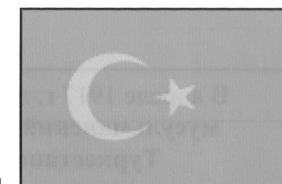
Флаг автономии Алаш - Орда

Лидеры движения Алаш (А.Байтурсынов, А.Букейханов, М.Дулатов,) негативно отнеслись к Октябрьской революции и установлению Советской власти.