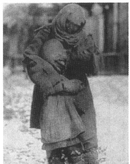
Голодная мать с ребенком мерзнут на улице