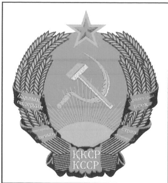
Герб КазССР 1939 г.

В составе РСФСР КазАССР превратилась в развитую индустриально-аграрную республику.