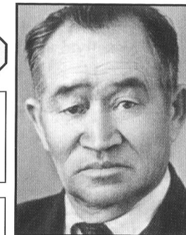
Кастеев Абильхан (1904–1973) Живописец, график, один из основателей казахского изобразительного искусства

В 1933г. был создан Союз художников КазАССР