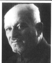
Александр Викторович Загаевич (1869– 1936)

Огромный интерес к казахской музыке проявил русский этнограф и композитор, один из основоположников казахской профессиональной фортепианной музыки, Народный артист Казахской АССР (1923г.) А.В. Загаевич