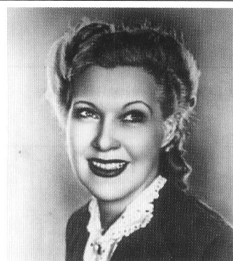
Орлова Любовь Петровна (1902-1975)

Советская актриса театра и кино. Лауреат двух Сталинских премий первой степени (1941, 1950). Народная артистка СССР (1950)