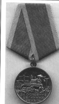
Медаль «За освоение целинных земель» 1956 г.

Десятки тысяч человек, приехавших на целину, за свой героический труд были награждены орденами, медалями и грамотами.