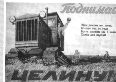
Агитплакат «Поднимай целину». Текст на плакате: «Этим землям нет цены, Больше год от года Брать должны мы с целины Хлеба для народа!»

По сравнению с 1939 г. численность населения республики в 1959 г. увеличилась на 3 млн. 216 тыс. человек и составила 9 млн. 295 тыс. человек. По результатам переписи населения 1959 г. , представителей коренной национальности в Казахстане было 2 млн. 787 тыс. человек, т.е. 29 % от общей численности населения.