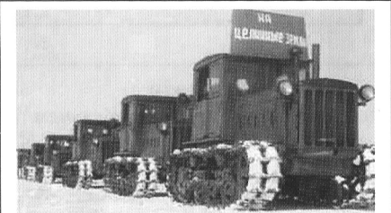
Прибытие в Тайнчинскую МТС бригады молодых механизаторов для освоения целины. Лозунг: «На целинные земли».