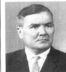
Ермухан Бекмаханов – историк, один из авторов труда «История Казахской ССР», (Алма-Ата, 1943г).

В начале 50-х годов в Казахстане возникло «дело Бекмаханова» . Автор монографии «Казахстан в 20-40-е годы» историк Е.Бекмаханов обвинялся в антирусской пропаганде и восхвалении народных восстаний, направленных против Российской империи. Положительная оценка, данная Е. Бекмахановым восстанию К.Касымова, была расценена как проявление буржуазно-националистической идеологии. Опубликованная в 1950 г. в газете «Правда» статья «За марксистско – ленинское освещение вопросов истории Казахстана» положила начало политическому преследованию историка. В апреле 1951г. ЦК КП (б) Казахстана принял постановление, в котором обвинения, изложенные в статье, были признаны обоснованными, а Е.Бекмаханов – виновным в «буржуазно - националистических взглядах». Решением коллегии по уголовным делам Верховного суда КазССР Е.Бекмаханов был осужден на 25 лет лишения свободы и сослан в один из лагерей. В 1954 г. при содействии крупных ученых из Москвы и Ленинграда он был оправдан.