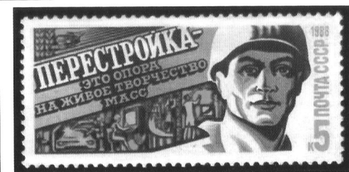
Почтовая марка СССР, 1988 г.

1991 г. – образование политических партий: Социал-демократическая партия Казахстана, «Алаш», «Желтоксан».